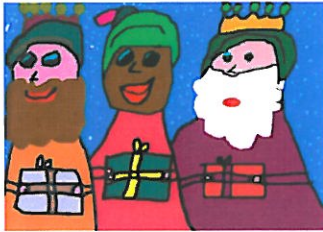
Ya vienen los Reyes...