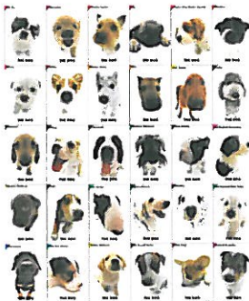
Nuestros amigos los perros